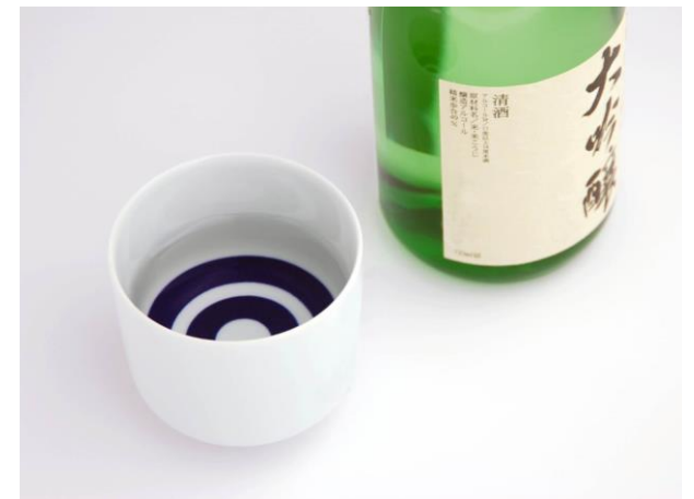
酒類の香気成分分析