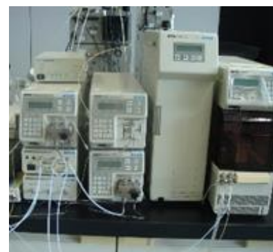
液体クロマトグラフ (核酸・有機酸分析システム) (2,010円/時間)