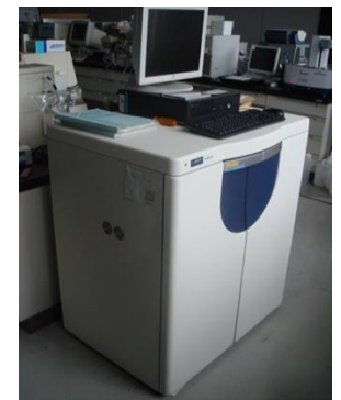
高速アミノ酸分析計 (L-8900) (3,080円/時間)

○その他の施設・設備は、福島県ハイテックプラザ 施設・設備データベースからご覧いただけます。