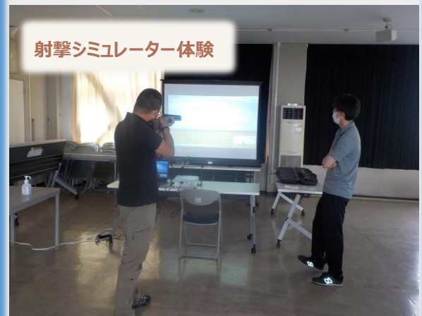
射撃シミュレーター体験