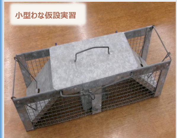
小型わな仮設実習