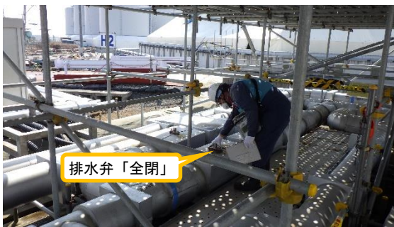
(写真2-1) 排水しないグループ1及び2の 排水弁の「全閉」確認状況①