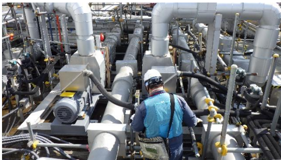
(写真 4) 排水ポンプ起動後の確認状況