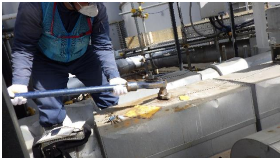
(写真 3) 排水弁の「全開」作業状況 ※今回排水対象としているグループ 3 排水弁の状況