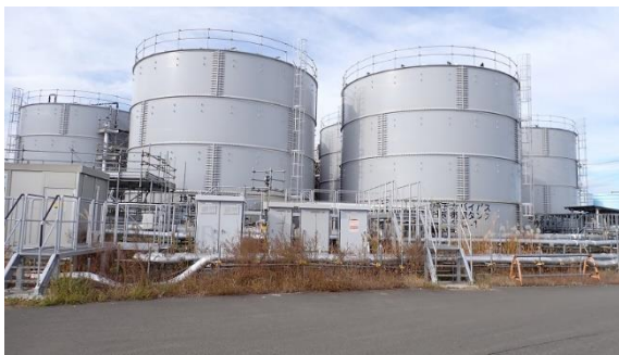
(写真1) 地下水バイパス一時貯留タンク エリアの外観