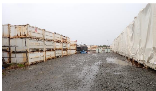
(写真 1-2) 一時保管エリアW入口付近の状況 (令和 6 年 4 月 9 日撮影)