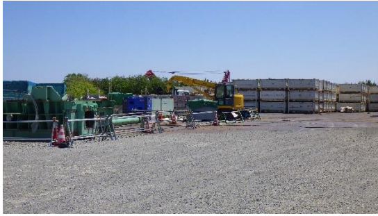
(写真 1 - 3) 一時保管エリアW入口付近の状況 (令和 7 年 5 月 8 日撮影)