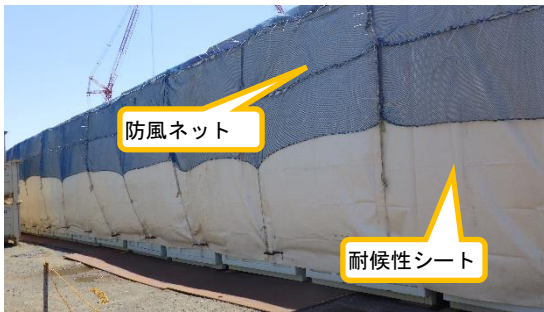
(写真 2 - 1) 一部コンテナにおける耐候性シートの 設置状況①