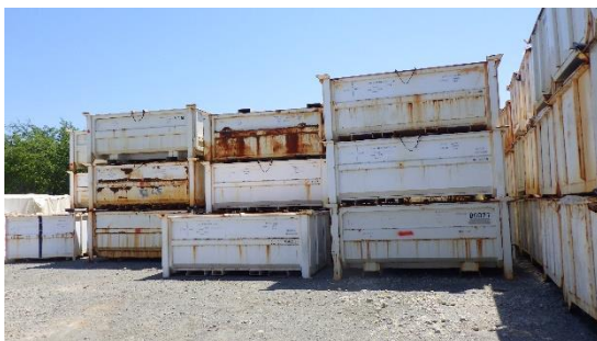
(写真 3) 一時保管エリアWの奥側（東側） の状況