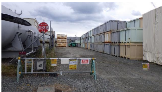
(写真 1-1) 一時保管エリアW入口付近の状況 (令和 4 年 10 月 24 日撮影)