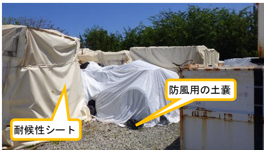
(写真 2 - 2) 一部コンテナにおける耐候性シートの 設置状況②