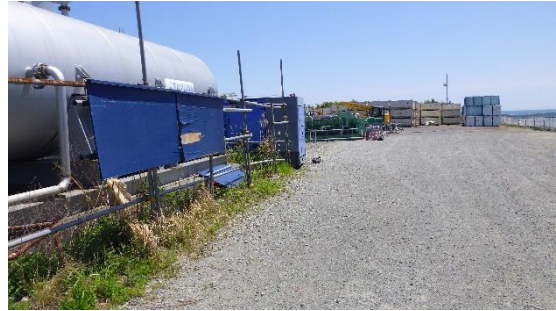
(写真 1 - 4) 一時保管エリアW入口付近の状況 (令和 7 年 5 月 8 日撮影)