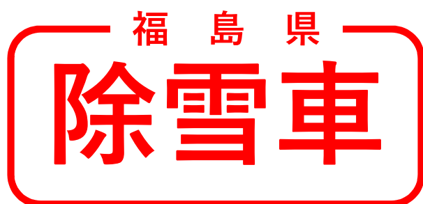
別図－ 3 後方標識板