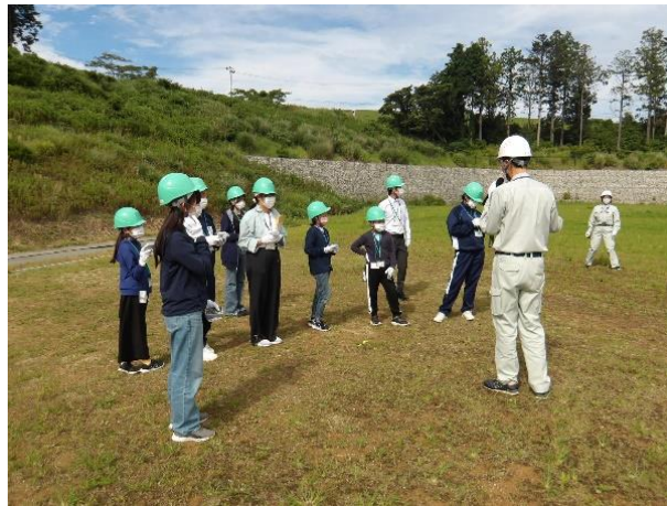
<2班 中間貯蔵事業情報センター>