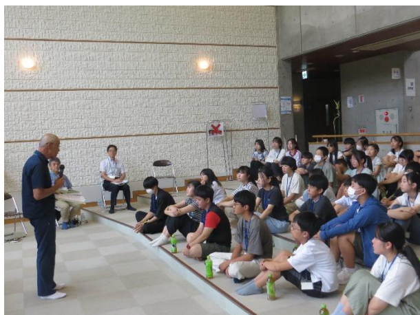
＜全体ミーティング＞