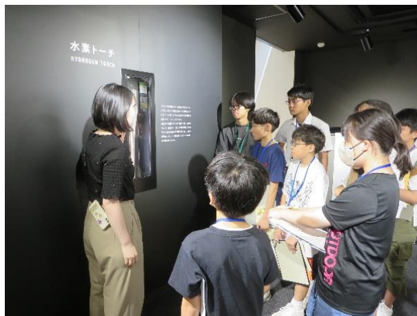
<4班 福島水素エネルギー 研究フィールド>