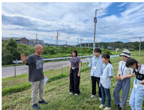
<6班 とみおかワイナリー>