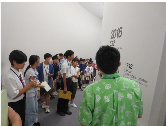
<東日本大震災・原子力災害伝承館見学③>