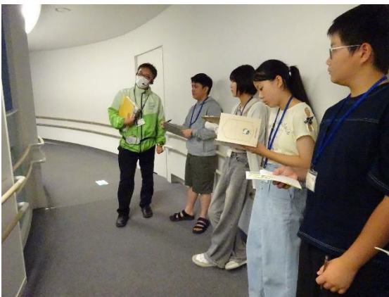
<東日本大震災・原子力災害伝承館見学①>