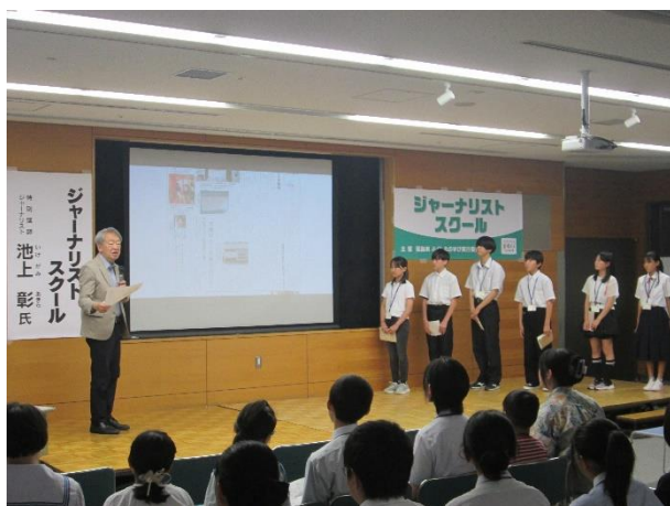
<発表に対する講評>