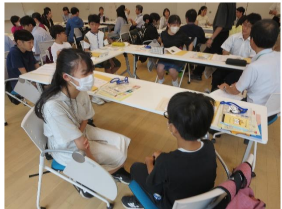
<オリエンテーション>