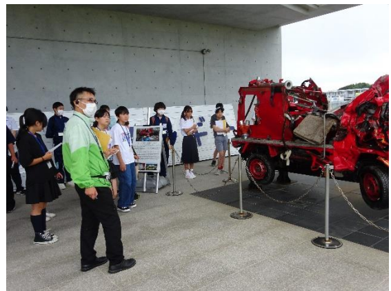
<東日本大震災・原子力災害伝承館見学②>