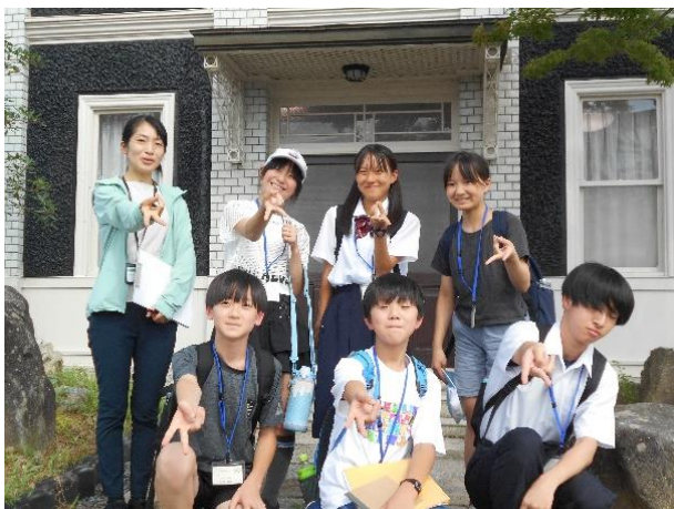
<1班 一般社団法人 ふたばプロジェクト>