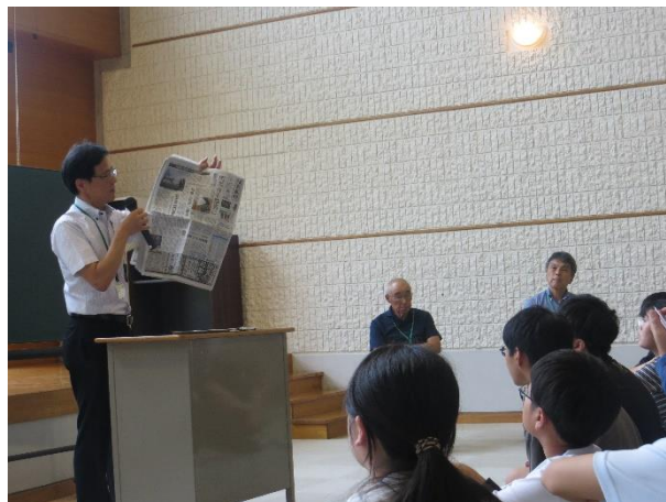
＜講義：記事の書き方＞