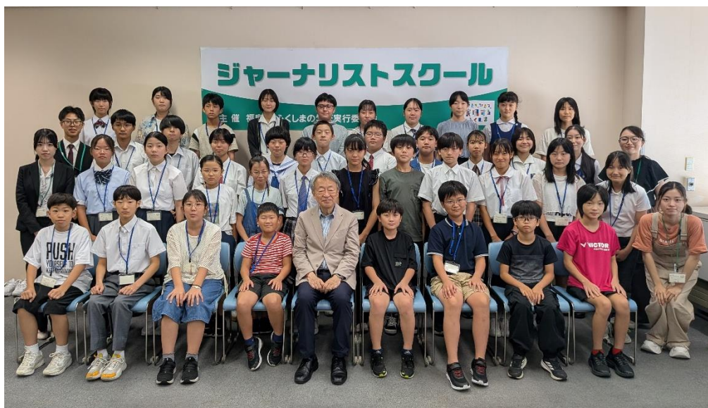
<池上先生との集合写真>