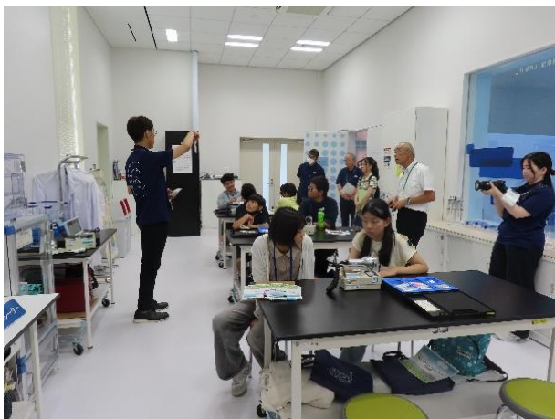
<3班 JAEA ANALYSIS LAB.>