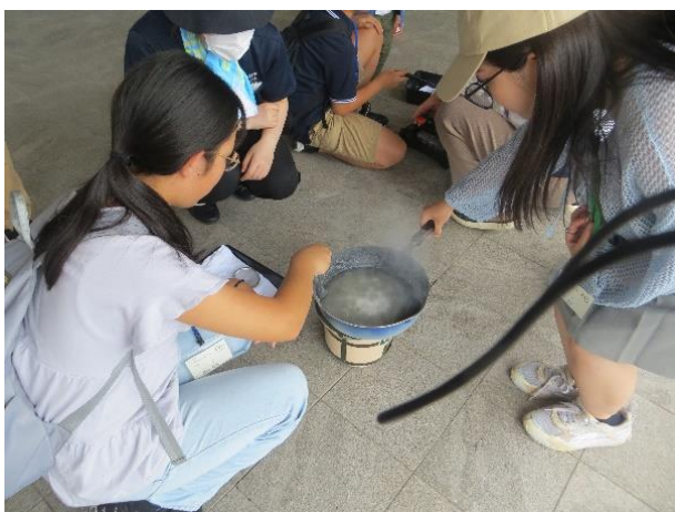
<5班 とみおかアーカイブ ミュージアム >