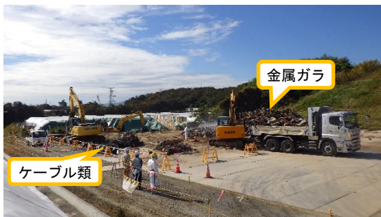
(写真 1－2) 分別後の瓦礫類の仮置き状況①