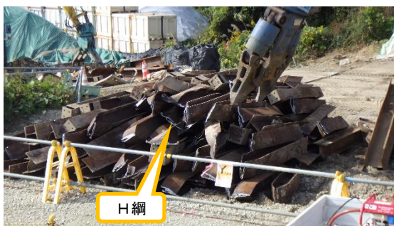
(写真 1－3) 分別後の瓦礫類の仮置き状況②