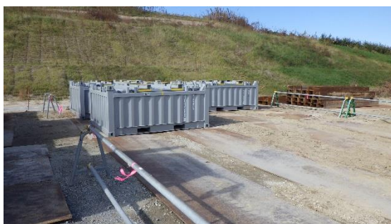
(写真 1－4) 運び出されるコンテナの保管状況