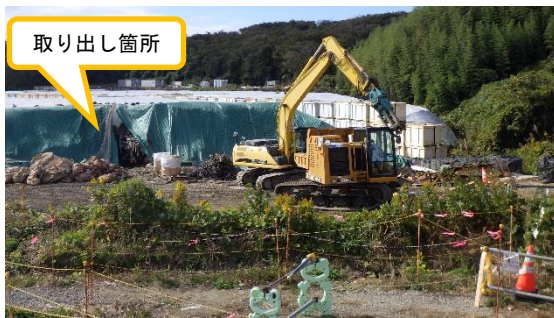
(写真 1－1) 瓦礫類の取り出し作業