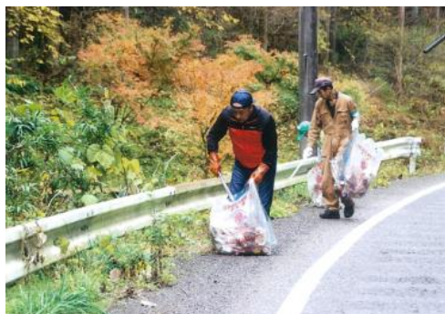
古殿須賀川線 石川町中田区会（石川町）