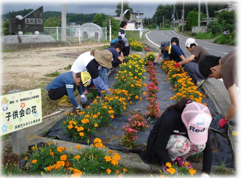
社田浅川線 白河市 「深渡戸ふるさと保存会」

～個性と魅力ある「みち空間」の創造～ 「ともに考え、ともにつくる”みちづくり”」