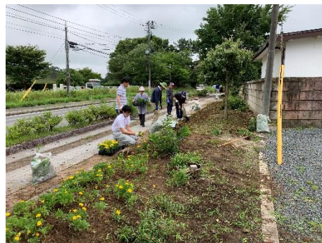
浪江鹿島線 本陣前一丁目行政区（南相馬市）