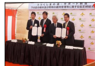
七日町通りまちなみ協議会 (会津若松市) 平成30年4月27日