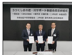
木幡地区大実取愛護会 (二本松市) 令和7年12月4日