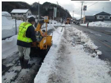
国道121号 新町行政区（南会津町）