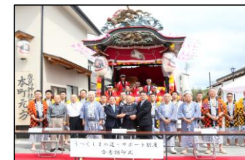
白河市本町自治会 (白河市) 平成30年9月16日