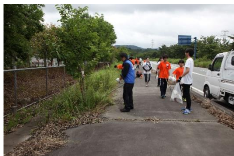
上北迫下北迫線 ハッピーロードネット（広野町）