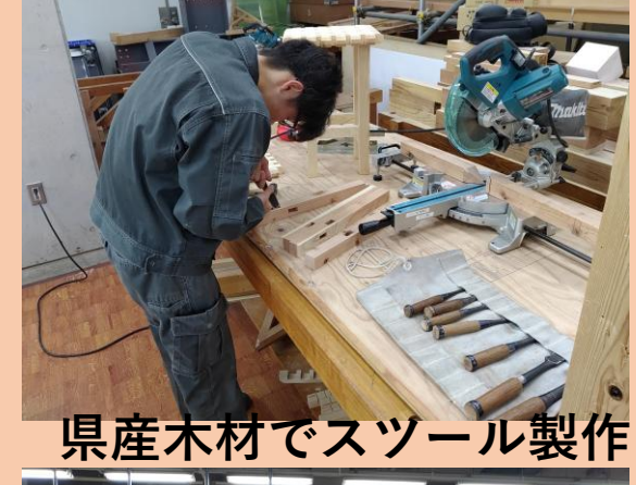
県産木材でスツール製作