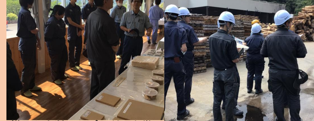
様々な木質チップの利用を学ぶ 解体廃材から木質チップ化工程を見学