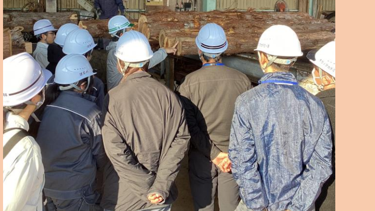
丸太から製材へ 製材所見学