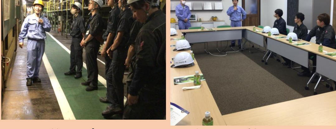
木質チップからパーティクルボードへの製造工程を見学 PB板の化粧仕上げを学ぶ