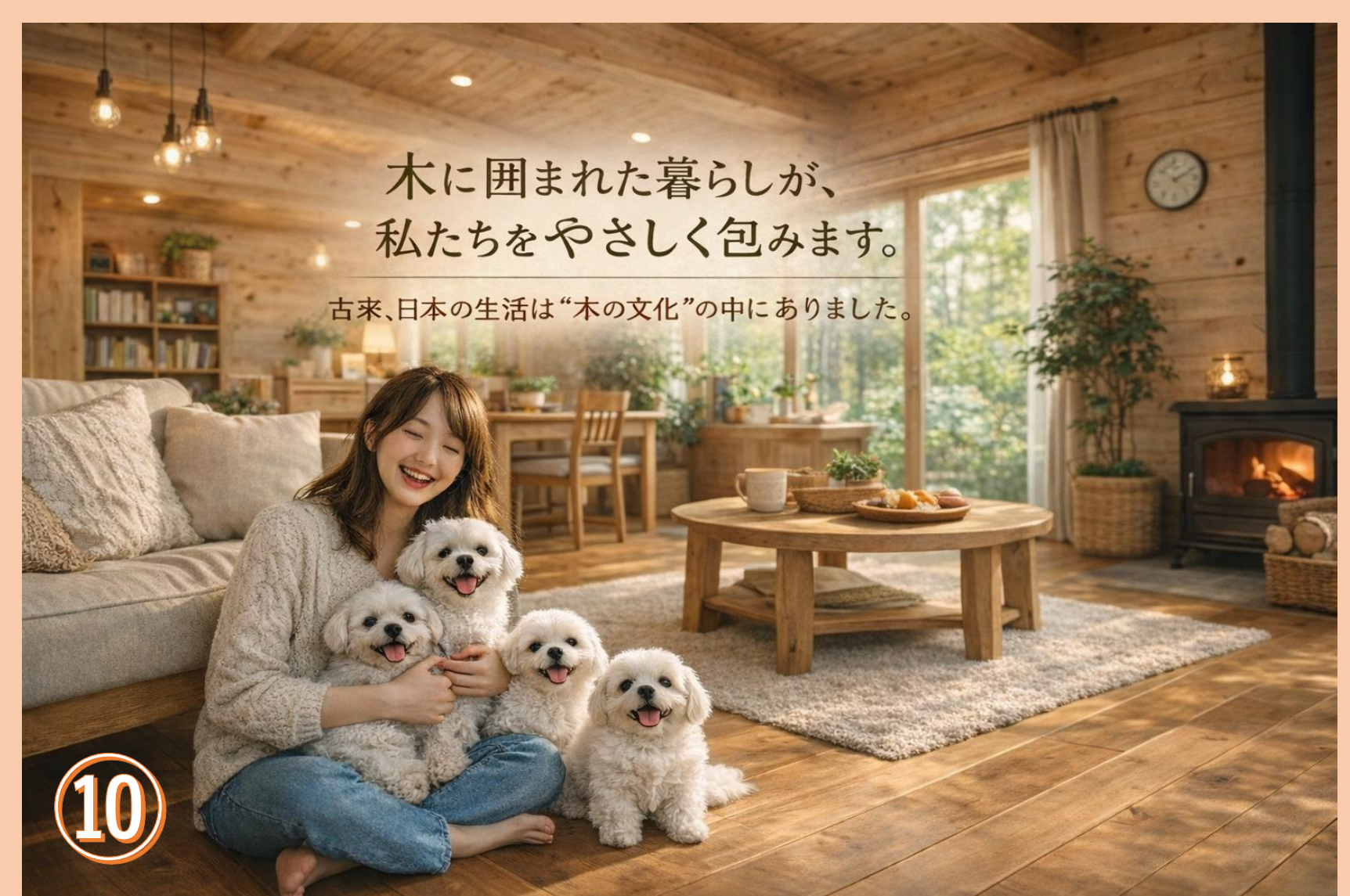
木に囲まれた暮らしが、私達をやさしく包みます。 古来、日本の生活は「木の文化」の中にありました。 福島県立テクノアカデミー浜 森を感じ、木を感じるものづくりプロジェクト