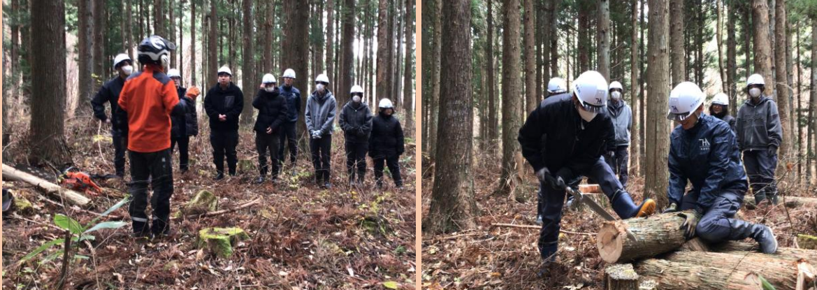
間伐研修 間伐材を手鋸で切断