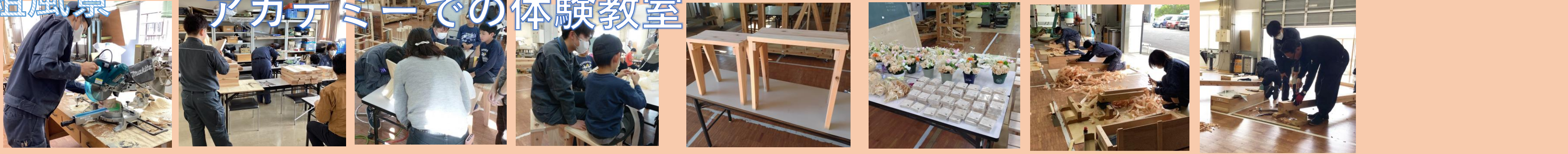
スライド丸鋸で切断の様子 椅子脚材料に墨付け 小学生ものづくり体験教室の講師を務めました 高校生ものづくり体験の作品です ものづくり体験教室の準備作業(県産材の鉋掛け)