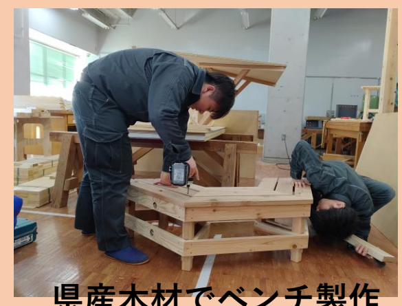
県産木材でベンチ製作