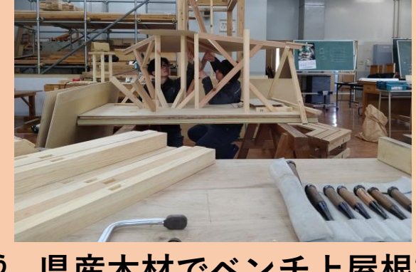
県産木材でベンチ屋根製作