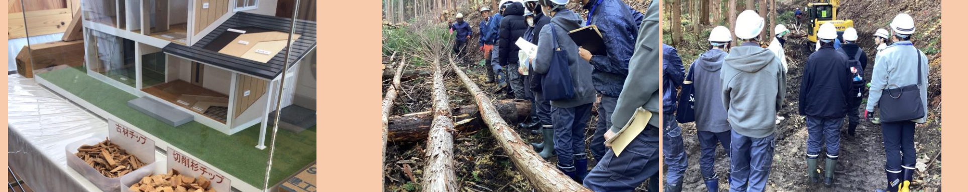
専用重機による森林間伐を見学(飯館村)