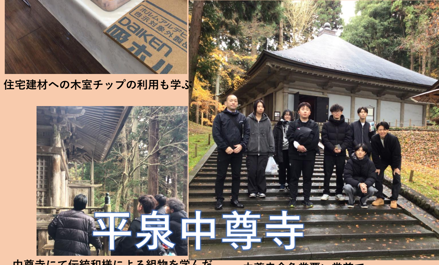
中尊寺にて伝統和様による組物を学んだ 中尊寺金色堂覆い堂前で 現代に継承される伝統工法を知ろう