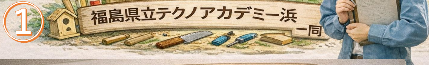
① 福島県立テクノアカデミー浜 一同

福島県では、県土の約7割が森林で、人工林も約3割を占めています。この広い森林資源の適切な管理と活用が、地域の林業振興や木材循環の鍵になります。