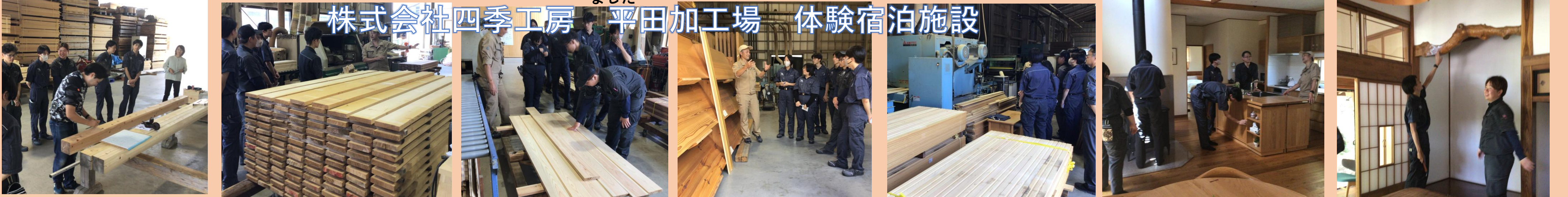
手刻み加工前の墨付け見学 浜校OBの棟梁が墨付け 天然材から無垢フローリング材加工を見学 天然材から無垢フローリング材加工② 様々な材種の造作材料 無垢材への特殊塗装工程見学 県産天然木材を使った体験宿泊施設を見学