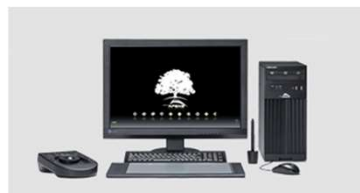
アパレルCADシステム (1,110円/時間)