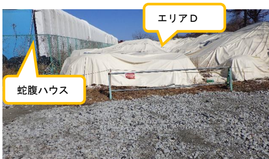
(写真1) エリアDの外観 ※エリアDは、廃棄物を保管するための蛇腹ハウスに隣接している