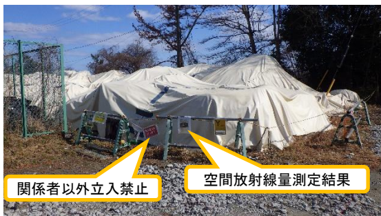
(写真2) エリアDの入口付近の状況