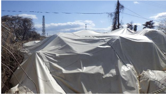
(写真3) 瓦礫類の保管状況