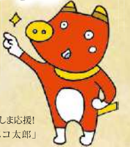
ふくしま応援! 「ペコ太郎」