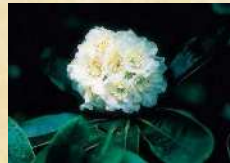
県の花：ネモトジャクナゲ