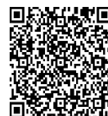
福島県慣行使用基準