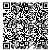
「環境保全型農業直接 支払交付金」について