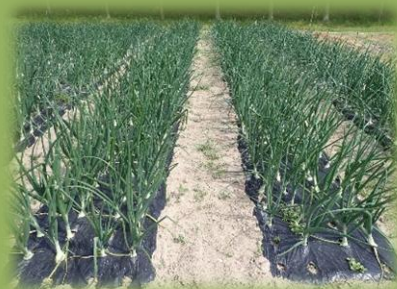
タマネギ栽培試験の様子