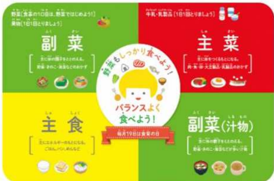
食のバランスをチェックするランチョンマップ