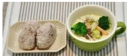
【栄養成分値(1人分)】※麦ごはん1膳を含む

Point! 具だくさんの「キャベツとブロッコリー豆乳みそ汁」と十五穀ごはんの2品で一食にできる朝食におすすめメニュー！ エネルギーは控えめで、タンパク質と食物繊維がしっかり摂れ、脂質は少な目のスマート和食バランス！