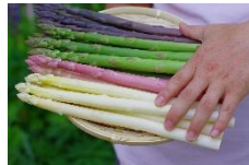
会津田島アスパラ