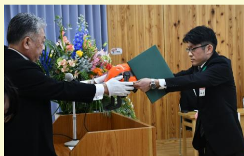
【研修許可書及び研修貸与品交付】