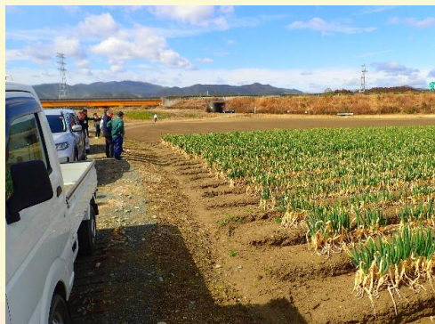
【高収益作物（ネギ）の栽培状況】

参加者からは、同じ課題について話が聞け、今回の研修はとても参考になったとの感想がありました。県中農林事務所では、引き続き関係機関と連携し、ほ場整備事業の実施に向け、支援してまいります。