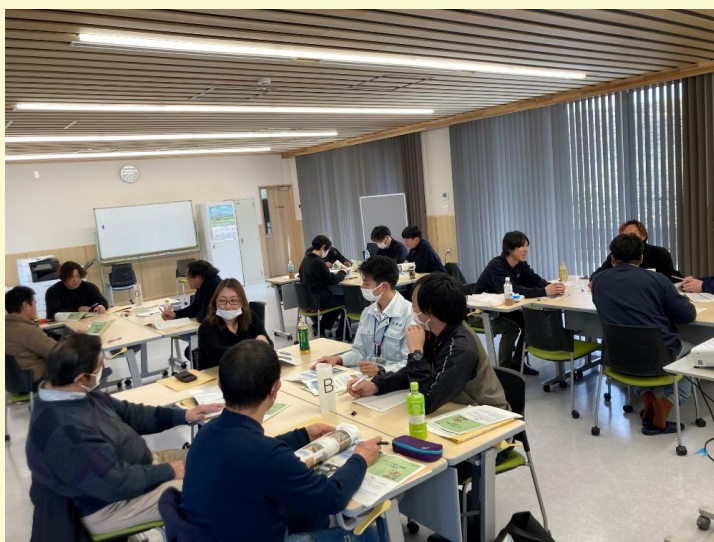
【第1回きゅうり基礎力アップ研修会の様子】