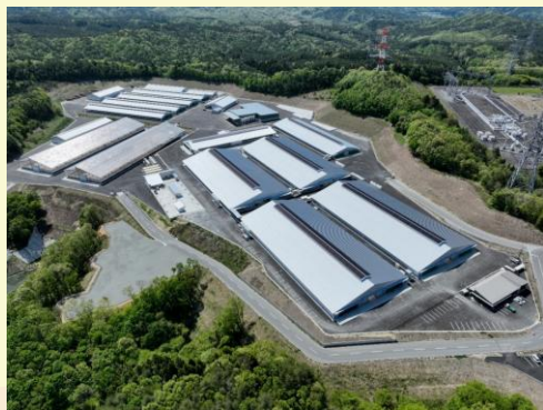
【全農美土里ファームの全景】

4月17日（金）、田村市都路町に完成した全農美土里ファームの竣工式が行われました。この農場は、株式会社美土里耕産が福島県高付加価値産地展開支援事業を活用し、震災・原発事故により大きなダメージを受けた被災地域の畜産業復興のための施設として整備しました。完成した畜舎には乳用牛、肉用牛合わせて約2,650頭が飼養される計画となっており、生乳の生産や被災地域の畜産農家へ肉用牛子牛等の優先供給、地域で生産された飼料の購入と堆肥の供給を通じ、地域農業の復興に貢献することが期待されます。