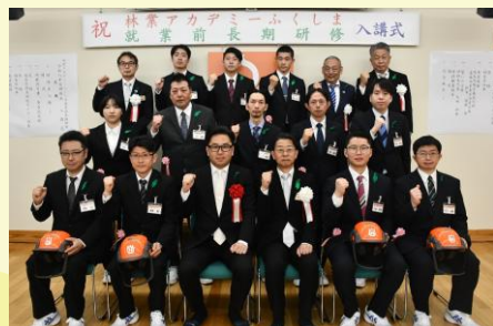
【5期生12名が入講しました】