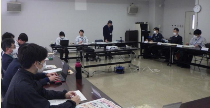
【産地ワーキンググループの様子】

2月9日（月）、令和7年度第2回「JA福島さくら・ピーマンならではのプラン」産地ワーキンググループを開催しました。当該産地のピーマンは、市場関係者より品質面での高い評価を受け、出荷量確保に強い要望を受けております。そこで、出荷量の安定確保、産地評価の維持、産地競争力の強化を図るプランの実現に向けたJA、市町村、農林事務所