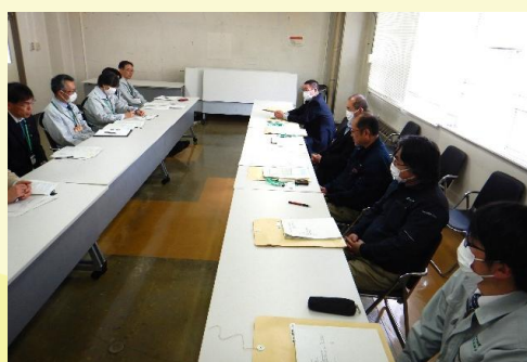
【パトロール協議会で情報交換】