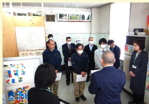
【農林事務所長より辞令交付】

県では巡視員の方々の1年間を通した巡視活動の結果をもとに、保安林・県行造林地における林木の生育状況確認や林地崩壊等の早期発見、適正な保全管理に取り組んでまいります。