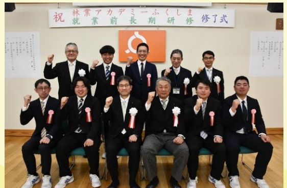
【第4期生6名が研修を修了しました】