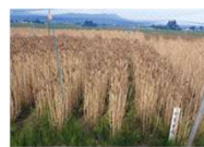
会津地域研究所(会津坂下) 夏黄金(6/17)