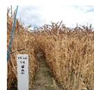
本部(郡山) 夏黄金 (6/15)