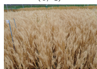
本部(郡山) きぬあずま (6/8)