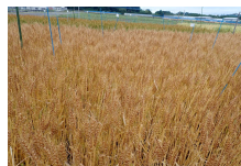
本部(郡山) さとのそら (6/4)

※本部「ゆきちから」は令和4年産、「さとのそら」は令和7年産、「夏黄金」は令和8年産、会津「夏黄金」は令和8年産、浜「さとのそら」は令和6年産、「夏黄金」は令和8年産から開始。