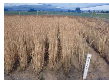
会津地域研究所(会津坂下) ゆきちから(6/17)