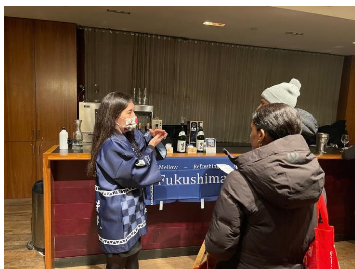
サーバーは各蔵元契約の現地販売促進員等が担当