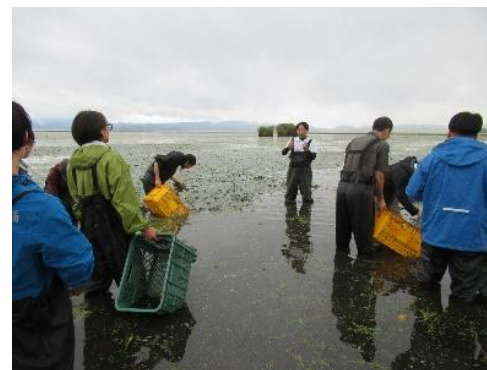
活動支援研修の様子