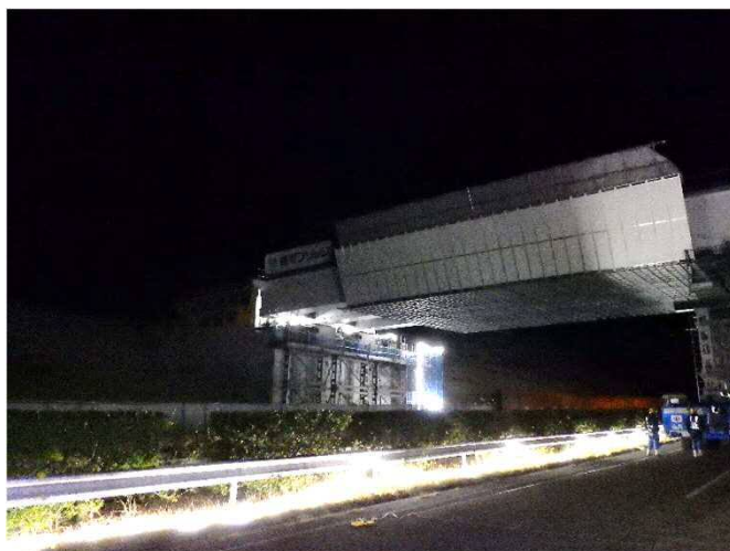
運搬状況②:ほぼ架設位置へ運びました