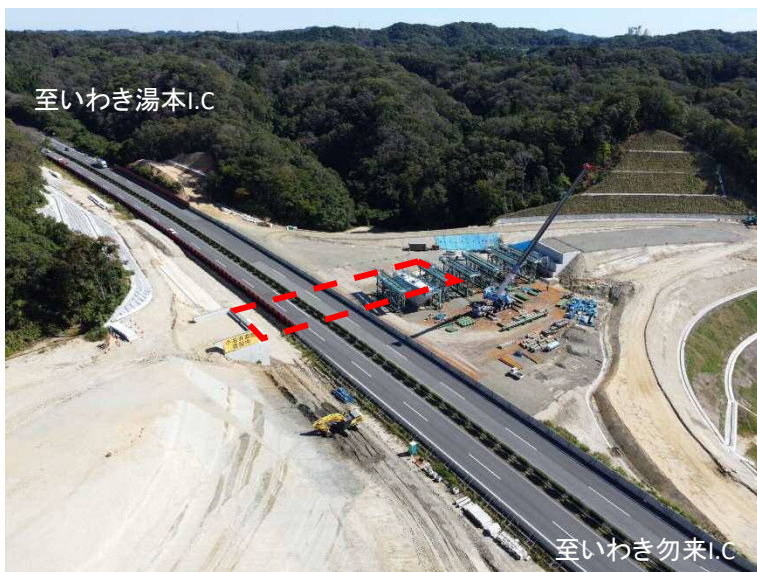
令和4年10月に撮影した仮称7号橋

常磐道の上に架かる2橋の内、仮称7号橋（小名浜IC橋）において令和4年12月20日の夜間に橋桁の架設が行われました。