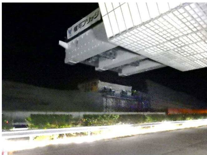
運搬状況①:奥の橋台へ向かいます