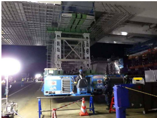
台車を慎重に操作しています