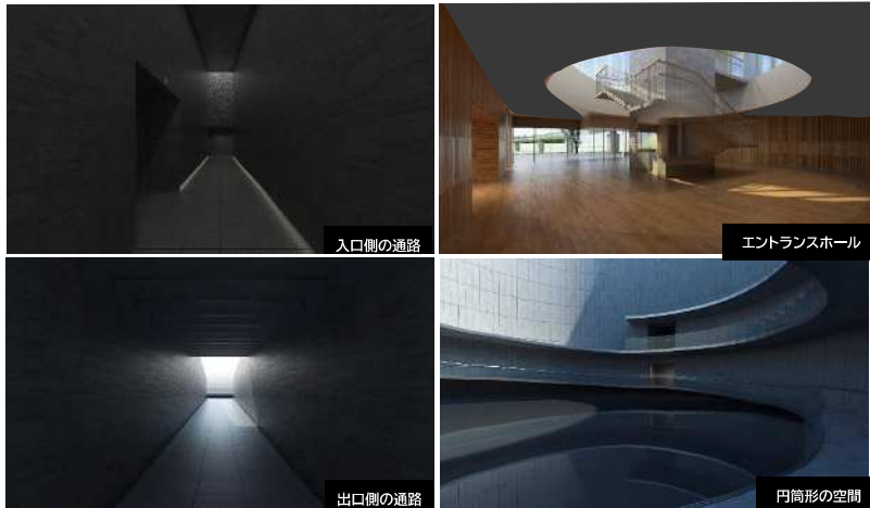
【国営追悼・祈念施設 建築物の構造】