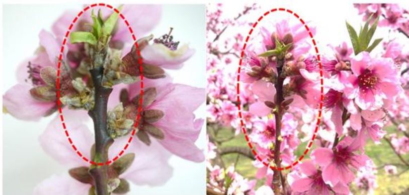
図2 枝先に発生した春型枝病斑

なお、春型枝病斑のせん除は、発病部位が残らないように病斑部の周辺を含めて可能な限り、基部から切り戻しましょう(図3)。