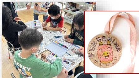
②木んメダルづくり