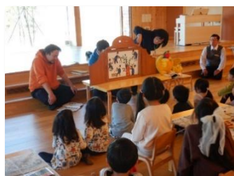
①紙芝居読み聞かせ