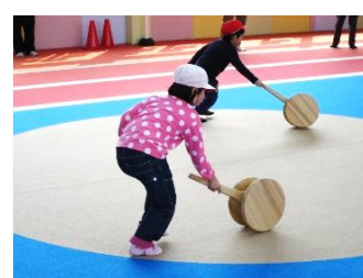
③運動会（コロコロリレー）